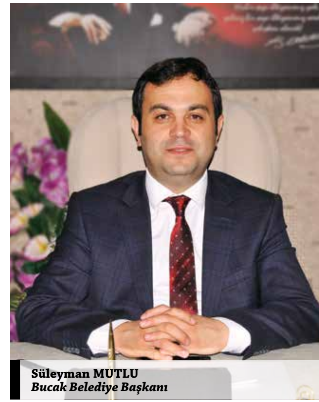
Süleyman MUTLU Bucak Belediye Başkanı